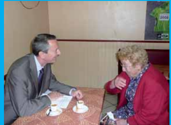
En permanence au bar de l'Europe à Monplaisir.