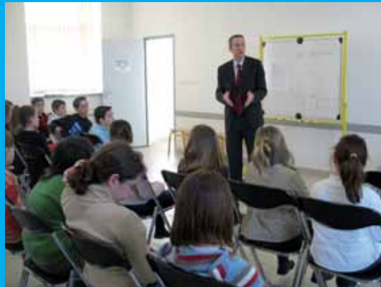
Avec les élèves de l'école du Rondeau à Tiercé