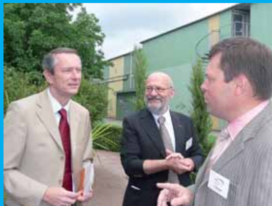
Aux 30 ans de l'entreprise CMI à Saint-Sylvain d'Anjou.