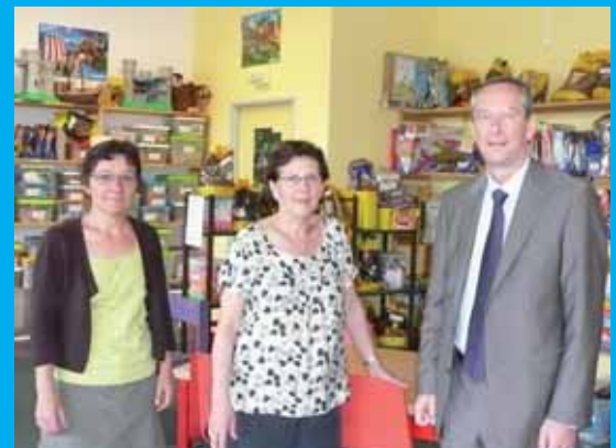
Avec les responsables de la Ludothèque de Monplaisir.