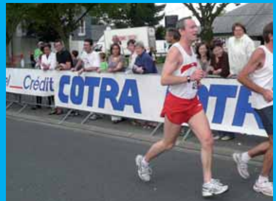
Au départ de la Grammoirienne, au Plessis-Grammoire.